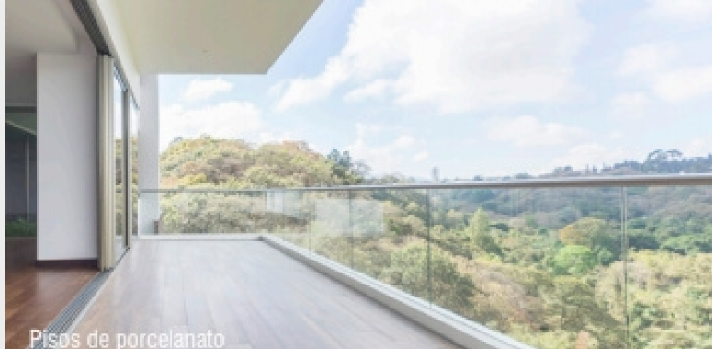
Pisos de porcelanato