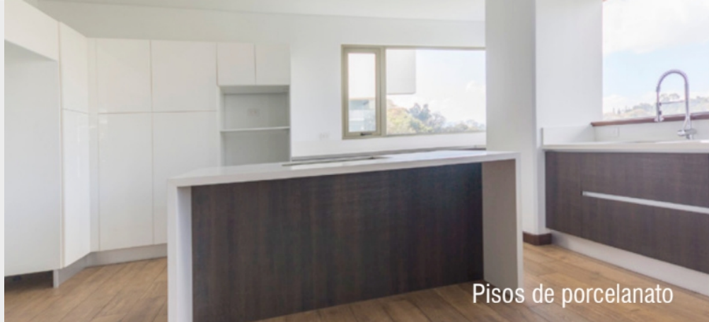
Pisos de porcelanato