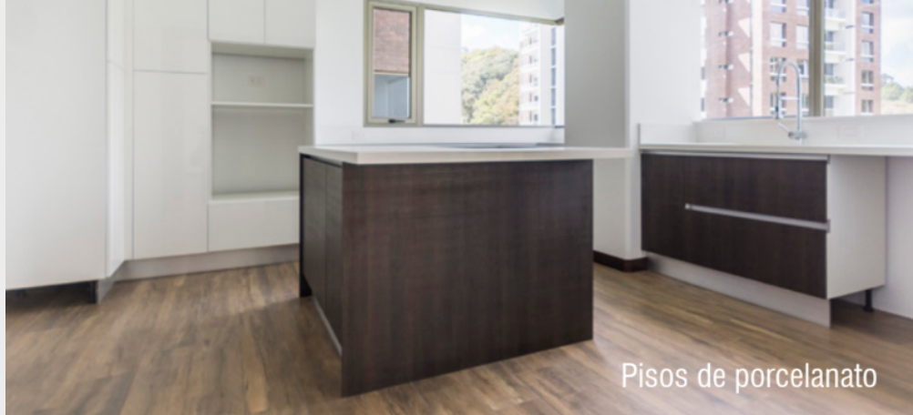
Pisos de porcelanato